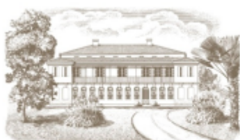
CHATEAU VIGNOL FAMILLE DOUBLET