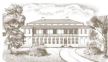
CHATEAU VIGNOL FAMILLE DOUBLET