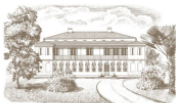
CHATEAU VIGNOL FAMILLE DOUBLET