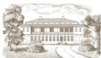
CHATEAU VIGNOL FAMILLE DOUBLET